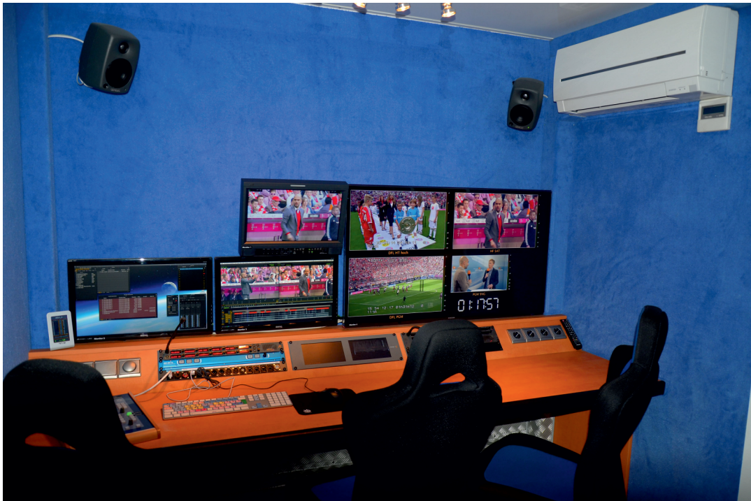
Schnittplatz 1 und 2 sind identisch ausgestattet