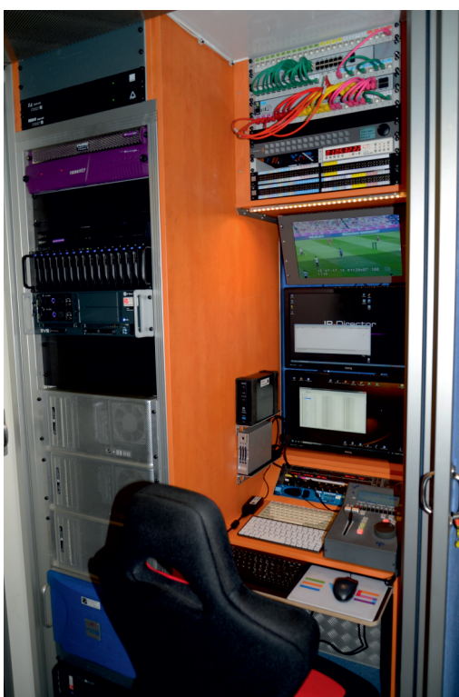
Adminplatz mit zentralem Ingest